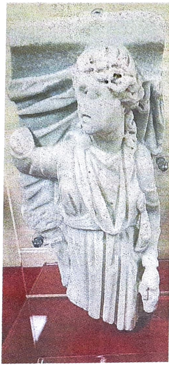
Archeologia Frammento di sarcofago proveniente da san Callisto, iscrizione sottratta dalla catacomba di Domitilla

Il più significativo, il frammento di sarcofago con una figura della Musa Talia (II secolo d.C.) proveniente dalla catacomba di san Callisto, è stato recuperato dal Coman-